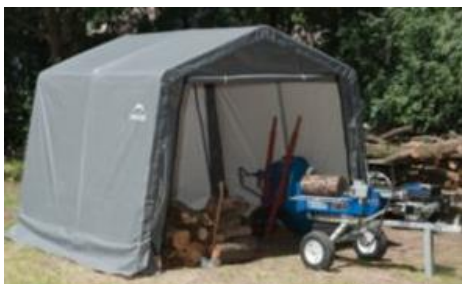
Abri à bois